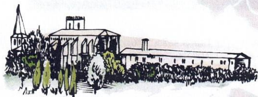
Abbaye Cistercienne Sainte Marie de BOULAU