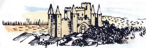
Eglise Abbatiale de SIMORRE