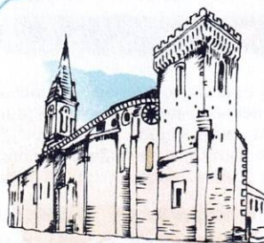
Eglise de SARAMON