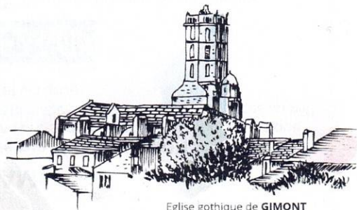
Eglise gothique de GIMONT